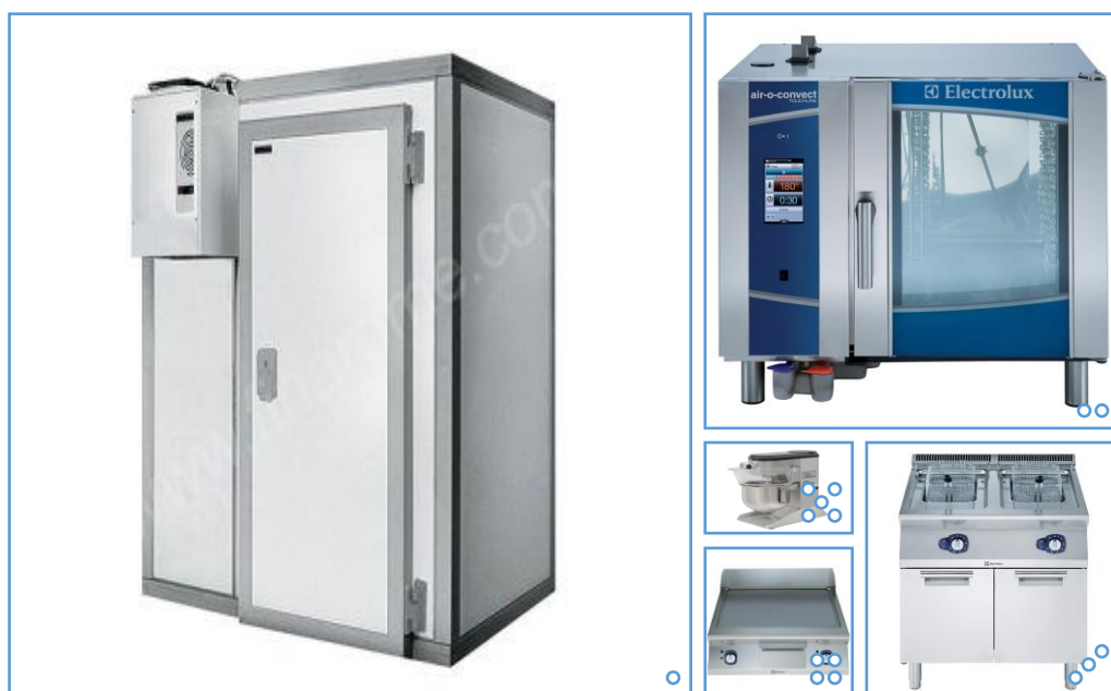
○ Chambre froide ○ Fours 6 niveaux ○ friteuse ○ Plancha ○ Batteur

La coopérative a besoin de capitaux pour démarrer son activité, pour notamment acquérir du matériel nécessaire à son exploitation. ( Fours électriques mixtes 6 niveaux, laminoir, cellules de refroidissement, batteurs 5-7L, combinés coupe légumes/cutter/malaxeur 4,5kg, tables de travail en inox, plonges, rayonnages, hottes, planchas, friteuses 18L, marmites 80 L, chambres froides, armoire congélation, micro-ondes... )